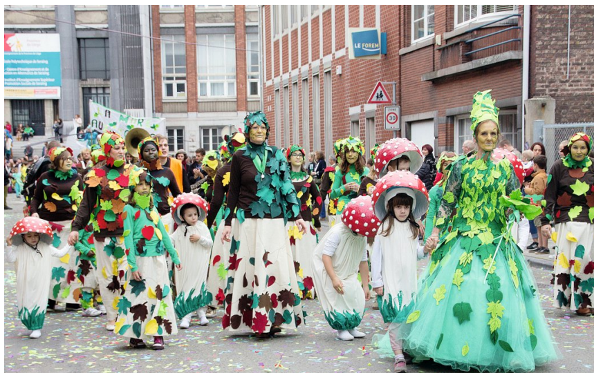
■ Lors de la dernière édition, en 2017, quelque 12 000 personnes ont assisté à la parade.

Plus d'infos sur www.fieris-feeries.be .